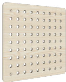
Painel Tipo 1