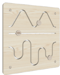
Painel Tipo 2