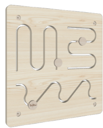
Painel Tipo 3