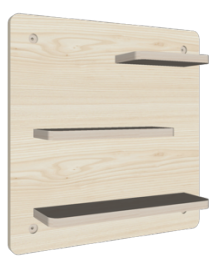
Painel Tipo 4